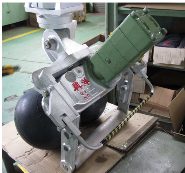
GV250 外観 (GRME油圧モータ付)

Vローラー方式のしらす曳き網船にて、作業時間の短縮を求め開発された吊下式のGV230ボールローラー