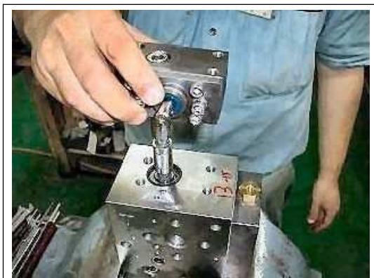
【12】新しいヘッド部を取り付ける