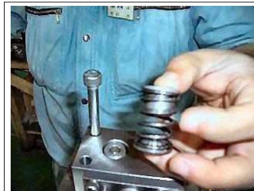
【21】スプリングを元の位置にセットする