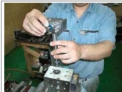
【13】スプールをピニオンギヤ（軸）にセットする