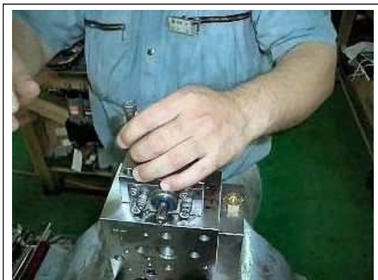
【11】位置関係ボルトを外す。