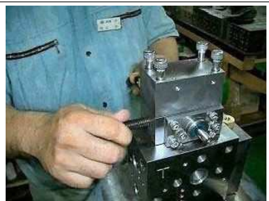
【28】 ボールプランジャー を戻す