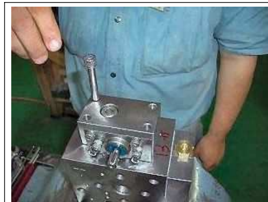
【20】位置固定のボルトを取り付ける