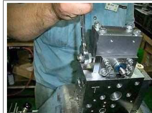
【3】ボールブランジャーを 外す