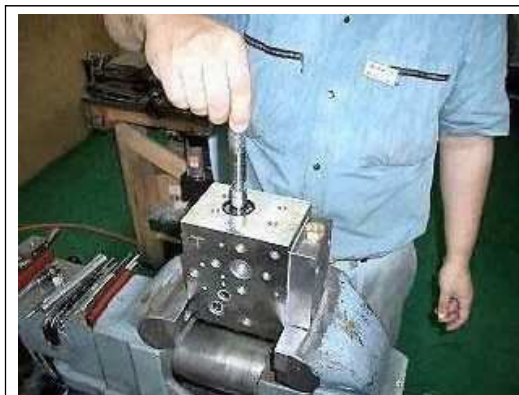
【14】スプールを本体に差し込む