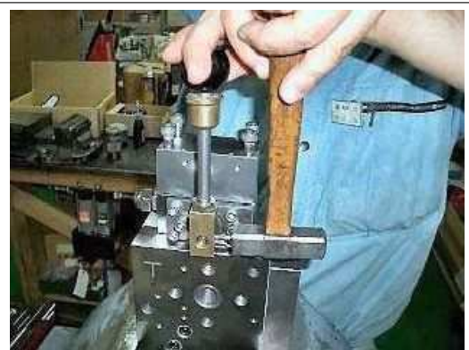
【30】 ハンドルを取り付け て完了